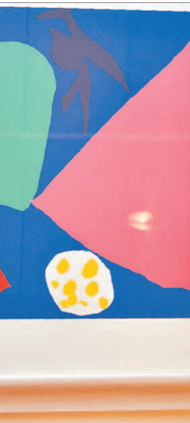
M. R. A.

tando el árbol y los monos están saltando... Creía que era lo que la gente esperaba de un buen directivo.