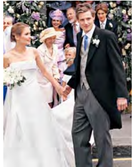
Sheherazade fue llamada "la mujer más suertuda de Gran Bretaña" cuando se casó con el millonario Zac Goldsmith.