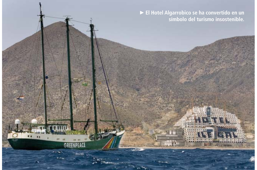
► El Hotel Algarobico se ha convertido en un símbolo del turismo insostenible.

► El papel de los gobiernos. Y es que si las empresas son uno de los actores que están impulsando el turismo sostenible, el otro ha de ser la voluntad de los gobiernos y de las instituciones transnacionales, como apunta el experto David Díaz Benavides, ex miembro de la Conferencia de las Naciones Unidas sobre Comercio y Desarrollo. “El turismo es una actividad extraterritorial que crea una sensación de libertad a veces mal entendida. En los países en vías de desarrollo tienen el problema añadido de que lo que es delito en Europa o Estados Unidos no está penado allí y muchas actividades ilícitas quedan impunes por este vacío legal”. Para que cada turista no cambie de conciencia cuando cambia de país, David Díaz sugiere internacionalizar el sistema sueco. “Si un ciudadano sueco es acusado de haber practicado turismo sexual en Malasia es juzgado en Suecia con los criterios de allí”.