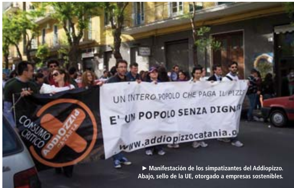
► Manifestación de los simpatizantes del Addiopizzo. Abajo, sello de la UE, otorgado a empresas sostenibles.

► Certificado de sostenibilidad. Más allá de iniciativas individuales, los grandes protagonistas del cambio a nivel global están siendo las empresas multinacionales que apuestan por un negocio sostenible. “Con sus elecciones están forzando a los turoperadores y a las cadenas hoteleras a cambiar sus formas de actuar”, insiste Palomo. Marcas como Ikea, Danone y Coca-Cola solo reservan