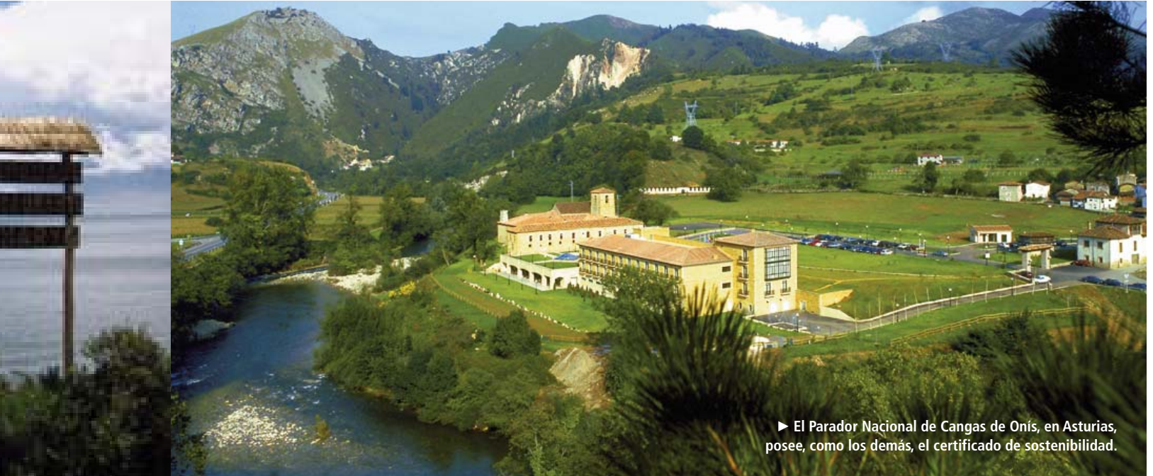
► El Parador Nacional de Cangas de Onís, en Asturias, posee, como los demás, el certificado de sostenibilidad.

han sido necesarios años de protestas por parte de los grupos ecologistas que han colocado en la retina de todos la imagen de esta masa de hormigón en la playa, y la preocupación por el turismo sostenible, en la agenda política.